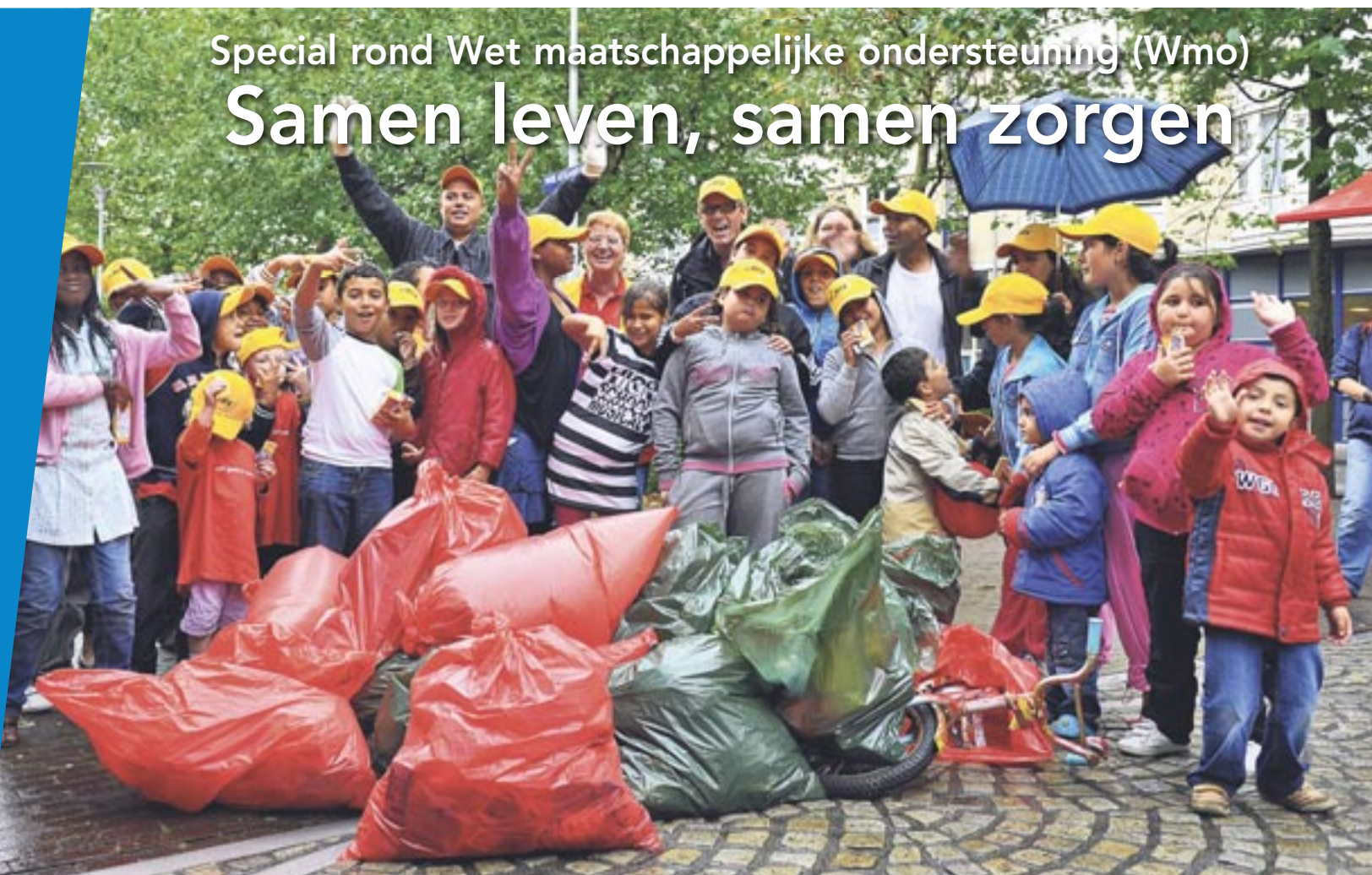
Helemaal in de geest van de Wmo was de actie 'Boen de Buurt' in september 2009. Tijdens deze actie kregen alle Oostelijke Eilanden een schoonmaakbeurt. Diverse teams met kinderen zamelden zoveel mogelijk zwerf- en grofvuil in. Ook stonden op alle eilanden containers voor grofvuil, werden portieken extra schoongeveegd en gevels schoongespoten. De actie was een initiatief van het Huis van de Buurt in samenwerking met woningcorporaties op de Oostelijk Eilanden, scholen, streetcornerwork, naschoolse opvang en de Reiniging met als doel een schone buurt voor en door iedereen.