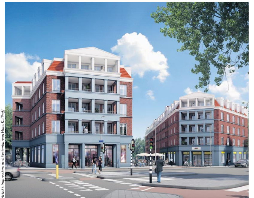
Artist's impression: architectenbureau Hans Kollhoff

Verspreid over twee bouwblokken worden circa 114 levensduurbestendige woningen gerealiseerd; dat zijn woningen waarin mensen op leeftijd kunnen blijven wonen: ze zijn gelijkvloers, hebben geen drempels en zijn goed toegankelijk. Dit sluit aan bij het beleid van het stadsdeel voor de buurt; de Czaar Peterbuurt moet een wijk worden waar je jong kunt zijn en oud kunt worden. Dertig woningen zijn bestemd voor de sociale huursector; de rest is bedoeld voor de vrije sector. Daarnaast worden binnen dit project een half verdiepte supermarkt en een ondergrondse parkeergarage aangelegd. Ten tijde van de uitwerking van het voorlopig ontwerp heeft de deelraad op 18 maart 2011 besloten om de geplande bibliotheek in N43 te schrappen. In lijn met de mogelijkheden wil de ontwikkelaar in deze ruimte graag winkels realiseren, waarmee het winkellint in de Czaar Peterstraat wordt versterkt. Verder is gebleken dat de oorspronkelijke situatie van de entree van de supermarkt voor de exploitatie van de supermarkt niet optimaal is. Het winkellint veroorzaakt in combinatie met de entree van de supermarkt aan de Czaar Peterstraat mogelijk veel drukte in de arcade, zoals fietsparkeerplekken. Vanwege bovenstaande redenen is in het nieuwe ontwerp, in afwijking op het vastgestelde