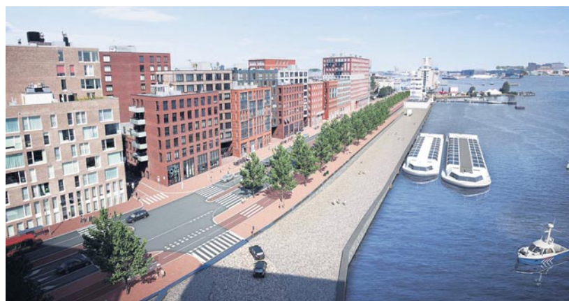
Artist's impression van de nieuwe Westerdokdijk.

De vernieuwing bestaat uit het aanbrengen van een nieuwe rijweg richting Barentszplein en de De Ruijterkade, een brede middenberm, aanleg van parkeervakken, een fietspad voor tweerichtingsverkeer, voetpad, bushaltes en een groenvoorziening. Ook komen er afslagstroken naar de Winthonstraat, de Leliëndaalstraat en de